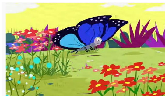
Pé de Sonho | Borboleta Azul